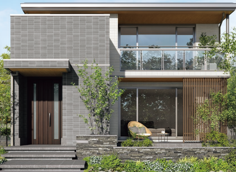
※掲載の写真はイメージです。裏面の物件とは異なります。