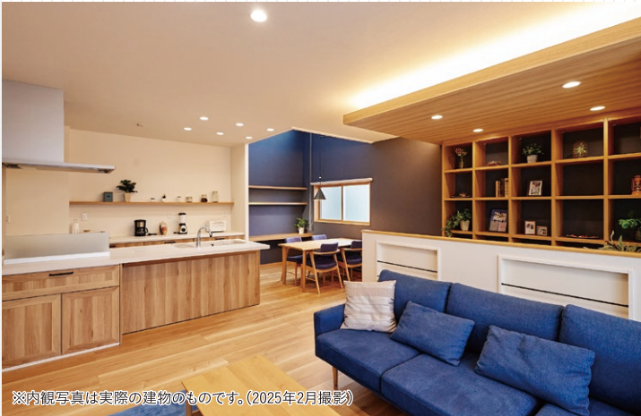
※肉親写真は実際の建物のものです。(2025年2月撮影)