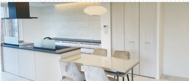
※内観写真は実際の建物のものです。(2024年8月撮影)